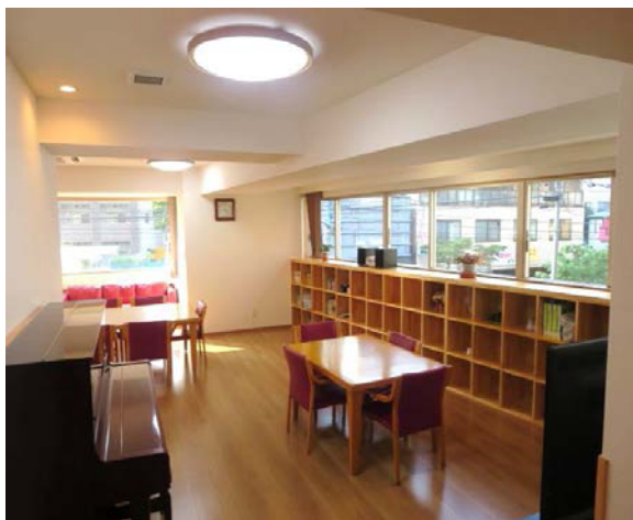
食堂・機能訓練室